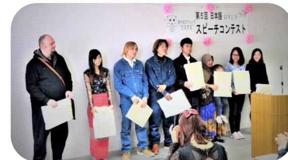
日本語スピーチコンテスト

新入会員(日本人)の教育や会員全体のレベルアップをはかるため、内部講師や外部講師による講習会を開催しています。また、年に一度学習者による日本語スピーチコンテストを行い、日本語の上達ぶりを披露します。