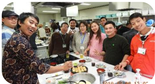
たこ焼きパーティー

学習者・会員相互の交流を図り、日本文化の紹介をします。見学会、料理教室、お茶会、書道教室をはじめ、全体の懇親会としてクスクスパーティーなどを開催しています。