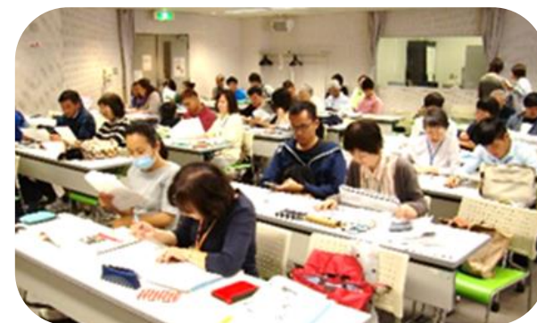
日本語教室でマンツーマン指導